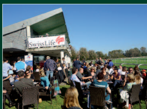
Rencontre SWISS LIFE

Parce que la réussite d'un évènement dépend aussi du choix du lieu