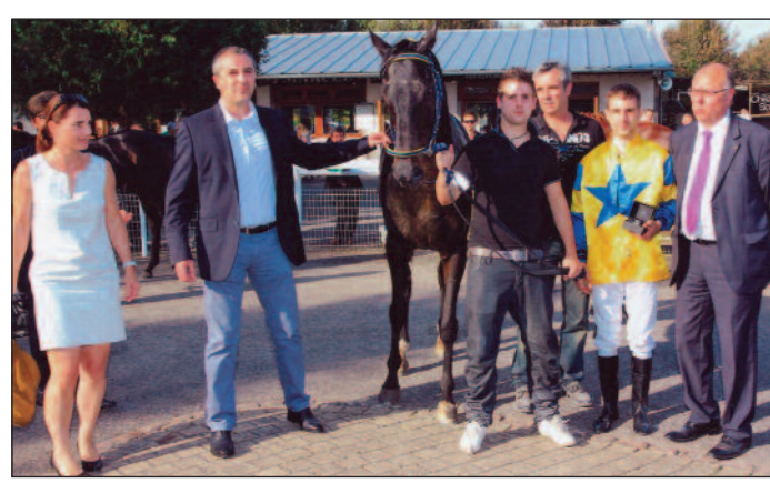
Monsieur Gervais remet le trophée du Grand Prix Pierre Lannier

Il s'agit là d'une prestation qui trouve toute sa place dans le plan de communication d'une entreprise comme la nôtre. »