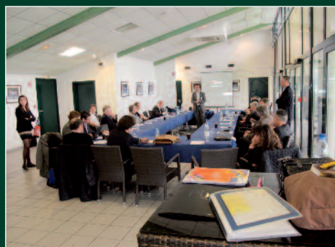
Réunion IBM avant les courses