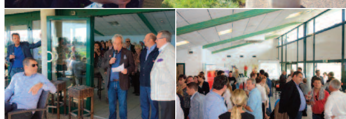
Les rencontres de la CGPME à l'Espace Entreprise

L'Hippodrome accueille la 1ère Journée Business Contact du BNI Strasbourg Dynamic Development