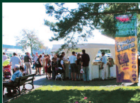
La Fête du chocolat