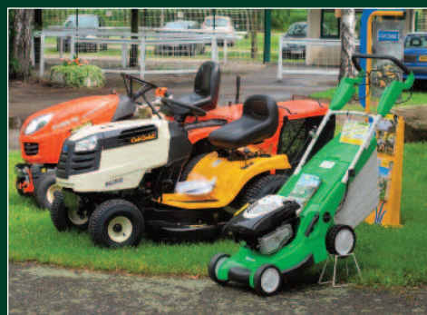
Exposition Ets Ruffenach

Pour vos réunions, séminaires, relations publiques, événements d'entreprises, lancement de produits, expositions, choisir l'hippodrome, situé dans un écrin de verdure à moins de 15 minutes de Strasbourg, c'est opter pour l'originalité.